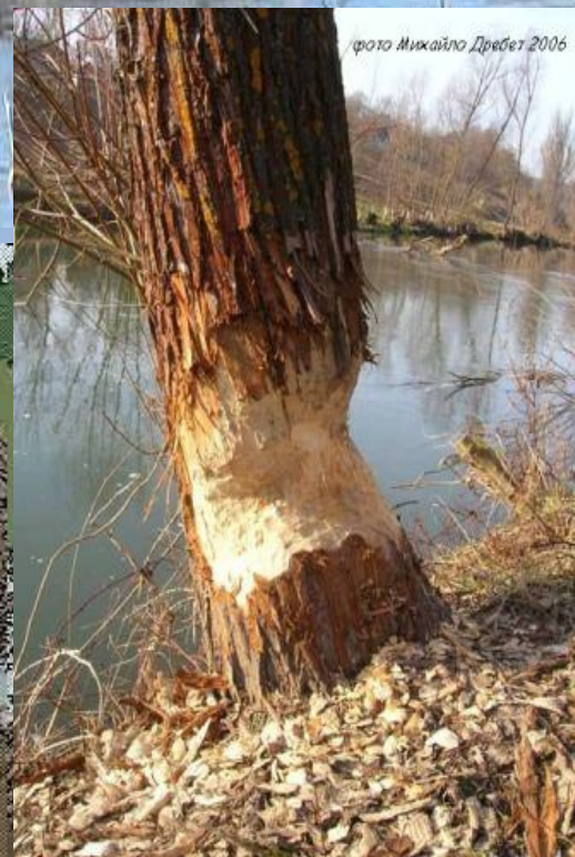
фото Михайло Дребет 2006